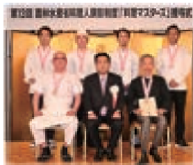
▲「料理マスターズ」で受賞した料理人の方々と記念撮影