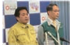
▲大野知事と共に記者会見に臨む