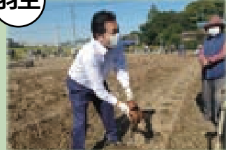
▲秋の芋掘り収穫祭