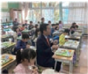
▲「和食給食イベント」で児童と一緒に給食