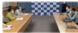
▲埼玉県に全面支援を約束