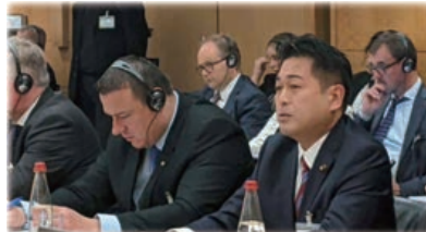
▲会合の場で食料安全保障について日本の立場を発言