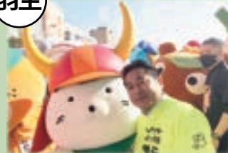
▲世界キャラクターさみっと in 羽生