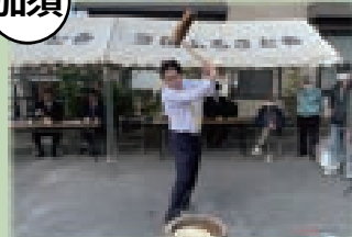
▲騎西地域餅つき大会