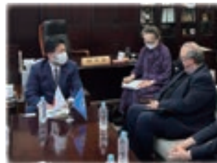
▲マッシモ・トレロ 国連食糧農業機関 (FAO) チーフエコノミストと会談