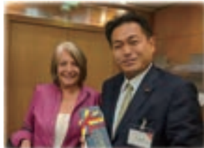
▲コロンビア モンターニョ 農業・地方開発大臣と歓談