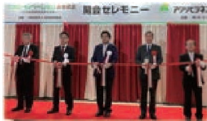
▲「アグリビジネス創出フェア2022」の開会セレモニー