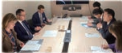
▲ドイツ エズデミル 食料・農業大臣と会談