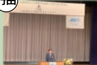
▲行田青年会議所新年会