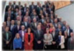
▲全体フォトセッション

大分県で開催された全国育樹祭では、皇太子妃両殿下が樹木を植えられた。式典会場には県産木材を使用した。素晴らしい施設だった。