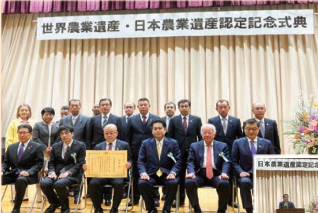
世界農業遺産・日本農業遺産認定記念式典