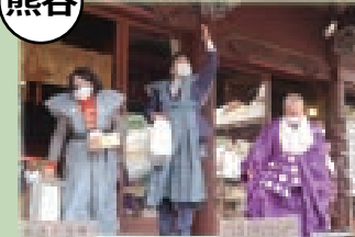
▲妻沼聖天山節分会