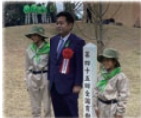
▲みどりの少年団の子どもたちと育樹

大分県で開催された全国育樹祭では、皇太子妃両殿下が樹木を植えられた。式典会場には県産木材を使用した。素晴らしい施設だった。